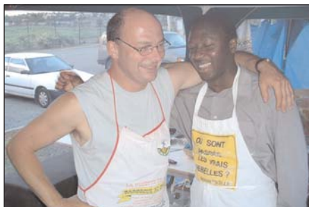
Nos deux cuistots ne sont pas peu fiers de leur performance, car c'en était une!

En plus de la bouffe ou de la musique, le plus agréable aura été sans doute pour plusieurs d'entre vous de danser et de palabrer doucement, au gré du temps, pour donner enfin le coup d'envoi à l'été.