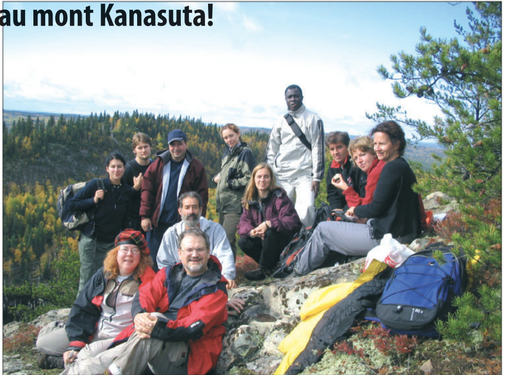
Douze des treize courageux randonneurs qui n'ont pas hésité à braver la pluie... et qui ne l'ont pas regretté!